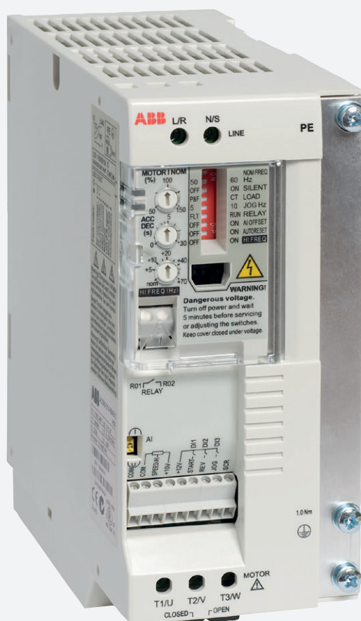
ABB Micro Drive ACS55, 0,18 bis 2,2 kW